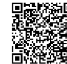
I) 親子ペアレッスン II) パパママとキッズ